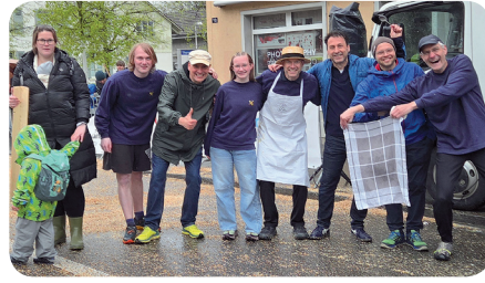
▲ Die Sportlichen vom MVB ▲