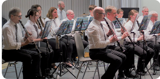
▼ Linker Flügel ... Zentrum ... Rechter Flügel ▼