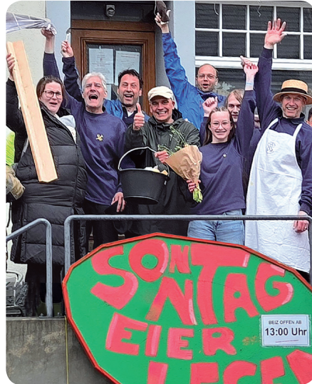
▼ ... zum Sieger ▼