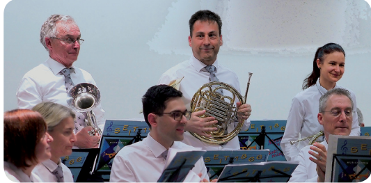
▲ Solisten und andere Unterhalter ▲