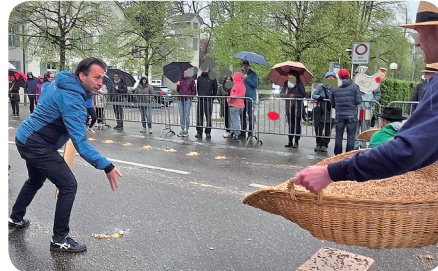
▲ ... und einem Glanzwurf ... ▲