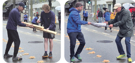
▼ mit viel Geschick und Gefühl ... ▼